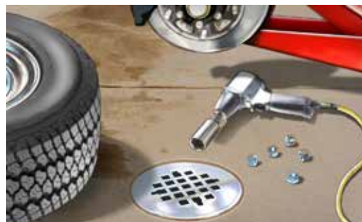
Sistema de drenaje de residuos sanitarios: un desagüe interno que desemboca en la planta de tratamiento de aguas residuales.