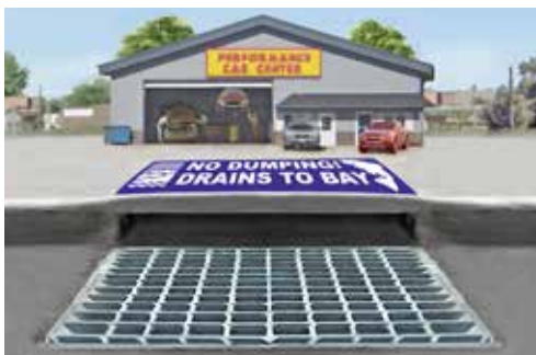
Alcantarilla: una alcantarilla externa que desemboca directamente en los arroyos y la Bahía.

Si su negocio cuenta con desagües de piso, comuníquese con la agencia de tratamiento de aguas residuales de su localidad a fin de informarse sobre los requisitos para desechar líquidos en el sistema de desagüe cloacal.