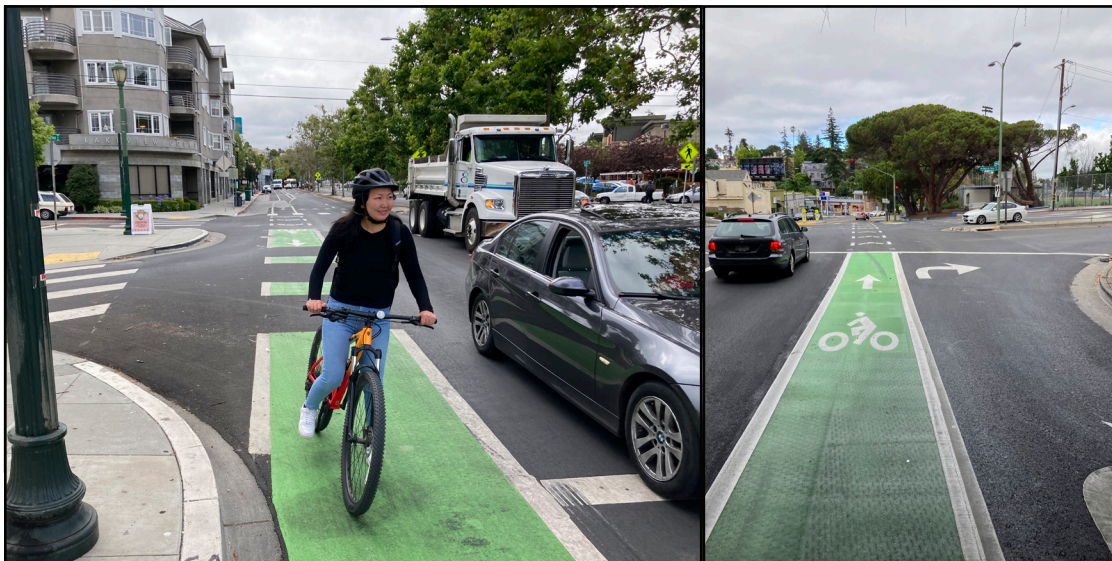
(Từ trái sang phải : ) Làn đường dành cho xe đạp có sọc xanh lục qua các khu vực xung đột tại 1) Athol Ave và làn rẽ phải tại Lakeshore Ave, và 2) làn rẽ phải tại MacArthur Blvd.

Nhân viên OakDOT xin cảm ơn nhiều người đã đóng góp cho dự án: những người ủng hộ khu phố, thương nhân Parkway, học sinh Trung học Phổ thông Oakland, nhân viên AC Transit, và nhân viên từ Ban Phân phối Dự án của Sở Công trình Công cộng của Oakland. Thông tin bổ sung về sự phát triển của dự án có tại www.oaklandca.gov/projects/lower-park-blvd-e-18th-st-3rd-ave-complete-streets-project .