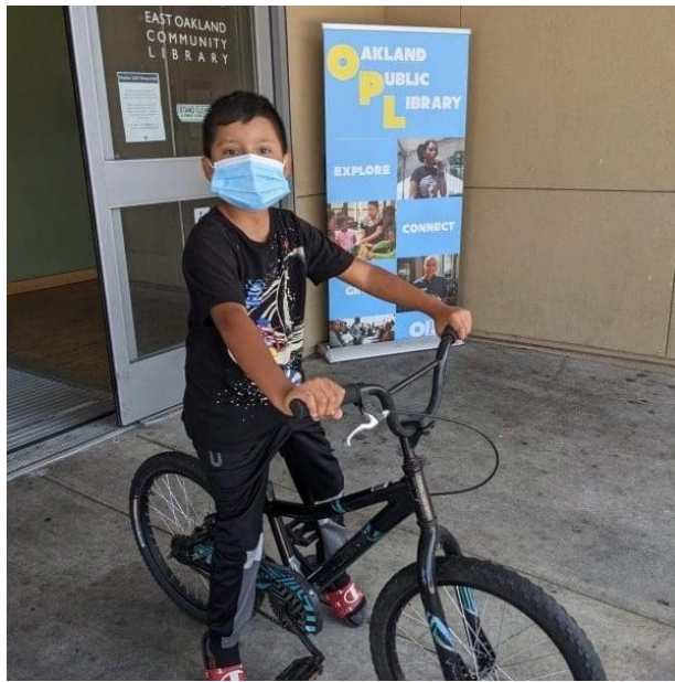
35 chiếc xe đạp đã được trao cho những người trẻ tuổi tại Thư viện Đại lộ 81 từ tháng 1 đến tháng 6 năm 2022.

Từ Tháng Giêng đến Tháng Sáu, 2022, Thư viện Công cộng Oakland (OPL) đã tổ chức 37 Địa điểm Sửa chữa Xe đạp và 3 Địa điểm Sửa chữa Xe đạp Lưu động, tặng 35 xe đạp cho thanh niên và tổ chức một loạt các sự kiện khác liên quan đến xe đạp tại và gần 81st Avenue và Martin Luther King Jr. Các chi nhánh. Để biết thêm thông tin về các địa điểm sửa chữa xe đạp trong tương lai, chương trình tặng quà, đạp xe theo nhóm và các sự kiện khác, hãy truy cập https://oaklandlibrary.org/bikes .