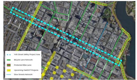
Dự án An toàn Đường phố 14 sẽ bao gồm các cải tiến từ Phố Chải đến Đường Lái xe bên Hồ.

Vào Tháng Hai, OakDOT nhận được $364,330 trong Dự án Công bằng Giao thông Bền vững (STEP) tài trợ từ Ban Tài nguyên Không khí California cho Trung tâm Tài nguyên Xe đạp Tây Oakland. Dự án sẽ được thực hiện bởi The Crucible, một trường nghệ thuật công nghiệp phi lợi nhuận có trụ sở tại West Oakland. Trung tâm Tài nguyên Xe đạp sẽ bao gồm các hội thảo miễn phí hàng tháng, đạp xe cộng đồng, phát triển kỹ năng cho nhân viên trẻ, các lớp học Earn-A-Bike, dịch vụ sửa chữa xe đạp và lắp đặt các trạm sửa chữa xe đạp. Khoản tài trợ STEP là sự hợp tác giữa OakDOT và Dự án Chỉ thị Môi trường Tây Oakland cũng bao gồm các chiến lược cải thiện tiếp cận phương tiện giao thông, phủ xanh đô thị và quản lý xe tải.