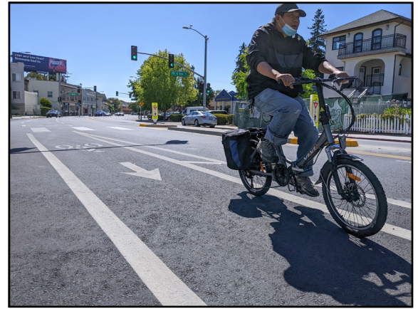
Làn đường dành cho xe đạp được bảo vệ gắn một hòn đảo an toàn dành cho người đi bộ mới được lắp đặt trên East 21 St.

Dự án cũng bao gồm việc tái cấu trúc đường E 18th St từ Park Blvd đến Lakeshore Ave, hoàn thành kết nối với Lake Merritt, bằng cách loại bỏ các làn đường đi lại để lắp đặt các làn đường dành cho xe đạp có vạch ngăn và cải thiện lối đi bộ trong khu thương mại Parkway. Làn đường dành cho xe đạp đã được thêm vào phần một chiều của 3rd Ave để cung cấp tuyến đường trực tiếp hơn từ Park Blvd đến E 18th St và Lake Merritt. Một đoạn đường của 4th Ave đã được tái cấu trúc để cải thiện kết nối của đường dành cho xe đạp 4th Ave đến Park Blvd và E 18th St. Và cuối cùng nhưng không kém phần quan trọng, sau các cuộc đàm phán kéo dài với Caltrans, dự án đã mở rộng các làn đường dành cho xe đạp theo I-580 trên Park Blvd từ MacArthur Blvd đến Chatham Rd.