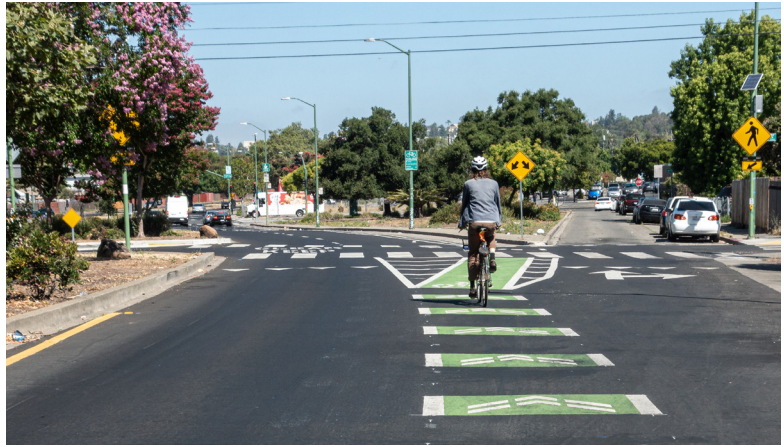
Một người đi xe đạp chạy qua khu vực xung đột sọc xanh lá cây trên Bancroft Ave tại 78th Ave.

Vào Tháng Ba, một dự án lát đường đã nâng cấp các làn đường dành cho xe đạp hiện có trên Bancroft Ave từ 42nd Ave tới 98th Ave, thu hẹp các làn đường đi lại và bổ sung các làn đường có vạch ngăn dành cho xe đạp ở phía đông 48th Ave. Các vạch kẻ đường dành cho xe đạp đã được bổ sung xuyên suốt và các làn đường dành cho xe đạp màu xanh lá cây cũng được đưa vào tại các giao lộ phức tạp. Dự án kết nối với các đường dành cho xe đạp giao nhau trên Havenscourt Blvd, Camden St, Church St, 73rd Ave, 90th Ave, và 98th Ave.