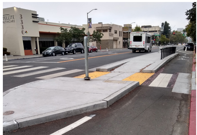
Đảo tải xe buýt tiếp giáp với làn đường dành riêng cho xe đạp, tiếp tục đến và đi từ làn đường dành cho xe đạp được bảo vệ và đảo an toàn cho người đi bộ.

Vào Tháng Ba, 2022, một dự án lát đường đã lắp đặt các làn đường dành cho xe đạp có vạch ngăn trên Telegraph Ave giữa 29th St và 37th St, thu hẹp khoảng cách để tạo ra các làn đường dành cho xe đạp liên tục từ 16th St đến 52nd St. Dự án này cũng lắp đặt các đảo lên xuống xe buýt và dỡ bỏ hai làn đường đi lại để dành không gian cho các làn đường dành cho xe đạp.