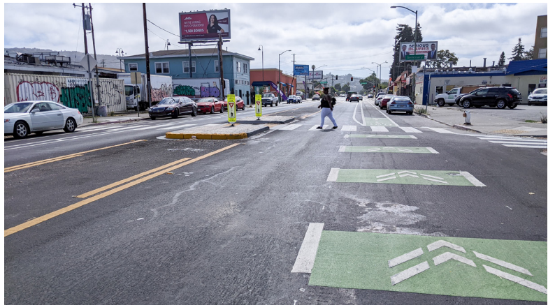
Người đi bộ tiếp cận hòn đảo an toàn dành cho người đi bộ qua lối đi dành cho người đi bộ ở phía đông Avenal Ave.

Đường dành cho xe đạp Bancroft Ave có làn đường dành cho xe đạp liên tục dài nhất trong toàn bộ Oakland, kéo dài 4.5 dặm từ 42nd Ave đến Durant Ave và tiếp tục đi vào San Leandro thêm 1.5 dặm. (Theo hướng đi về phía tây, có một khoảng cách ngắn làn đường dành cho xe đạp gần Havenscourt Blvd.) Đường dành cho xe đạp ban đầu được xây dựng bởi các dự án lát đường vào năm 2003 và 2008, với phần từ 98th Ave đến Durant Ave được nâng cấp thành làn đường dành cho xe đạp có vạch ngăn vào năm 2020.