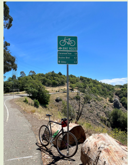
Các biển báo mới trên Grizzly Peak Blvd giúp người đi xe đạp tìm thấy điểm đến của họ.