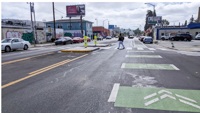
一名行人通過 Avenal Ave 以東的人行橫道接近行人安全島。

未來發展？詳情請見： www.oaklandca.gov/projects/bancroft-avenue-greenway 。