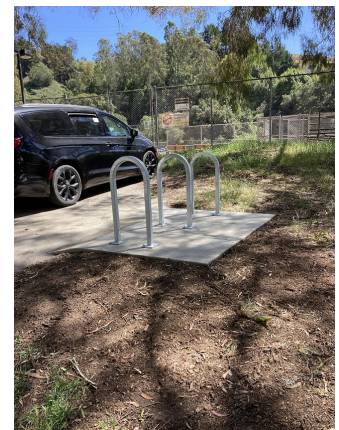
北奧克蘭體育中心用於自行車停放的新例 U 型架。

自行車停車位升級。 截至 2022 年 6 月 30 日, 屋崙 (奧克蘭) 公共自行車停車位, 共有 11,771 個。2022 年 1 月至 2022 年 6 月間, 設置了 84 個自行車停車位。新自行車停車位中, 有 48 個經《交通發展法》第 3 條 (Transportation Development Act, Article 3) 為第 14 期 Oakland's CityRacks Program 計畫所贊助, 而 36 個則是屬於私人開發項目部份。如欲申請車架, 請瀏覽 oaklandbikes.info/bikerack .