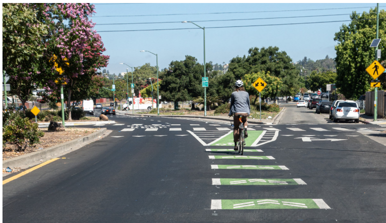
一名騎自行車的人在第 78 大道的班克羅夫特大道上的綠色條紋衝突區騎行。

3 月份，一項鋪路工程將 Bancroft Ave 的 42nd Ave 至 98th Ave 路段的自行車道進行升級，同時縮窄了車道，並在 48th Ave 以東增設自行車道緩衝區。各錯綜複雜的交叉路口中，除了加上「自行車道交叉口標記」，並增設「綠色自行車道」。該自行車道連接 Havenscourt Blvd、Camden St、Church St、73rd Ave、90th Ave 和 98th Ave 的交叉自行車道。