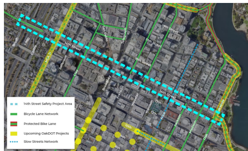
第 14 街安全項目將包括從 Brush Street 到 Lakeside Drive 的改進。

2022 年 1 月至 2022 年 6 月, OakDOT 獲得 $2,808,574 的具有競爭力的資助, 以資助和改善屋崙 (奧克蘭) 自行車項目。OakDOT 於一月份, 透過可負擔住房和永續發展社區 (Affordable Housing and Sustainable Communities, AHSC) 撥款計畫, 為兩個分別的自行車道項目, 獲得 2,444,244 美元: 「第 14 街安全項目」(14th Street Safety Project) ( www.oaklandca.gov/projects/14th-street ) 和第 27 街完整街道項目, 其中包括部分改善 27th St, Harrison St, Grand Ave 和 Bay Pl. California Strategic Growth Council 管理 AHSC 計畫, 以合宜住宅的資助獎勵, 結合各種可持續交通改善。