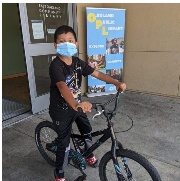
2022 年 1 月至 2022 年 6 月，第 81 大道圖書館向年輕人贈送了 35 輛自行車。

2022 年 1 月至 2022 年 6 月間，屋崙（奧克蘭）公共圖書館（OPL）舉辦了 37 個「自行車維修診所」（Bike Repair Clinics）和 3 個「移動自行車修理診所」（Mobile Bike Fix Clinics）活動，向青少年贈送了 35 輛自行車，並於 81st Avenue 和 Martin Luther King Jr. Branches 附近，舉辦一系列自行車主題活動。更多未來「自行車維修診所」（Bike Repair Clinics）、贈品、團體自行車騎行和其他活動的資訊，請瀏覽 https://oaklandlibrary.org/bikes 。