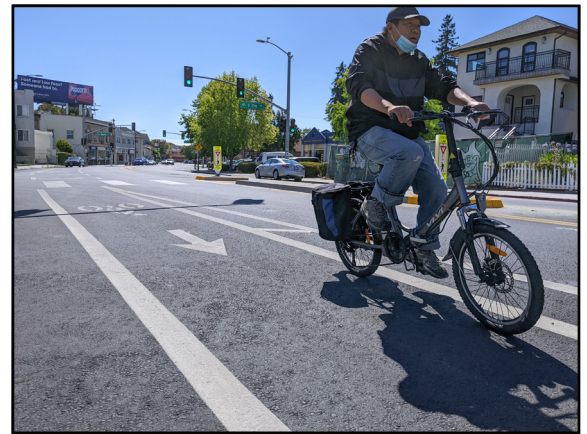
位於東 21 街新安裝的行人安全島附近的受保護自行車道。

該項目重新配置 E 18th St 的 Park Blvd 到 Lakeshore Ave 路段, 以拆除車道, 安裝緩衝自行車道, 並改善 Parkway 商業區的人行橫道, 從而連接美麗湖。3rd Ave 的單向部分, 增加一條自行車道, 從而為由 Park Blvd 至 E 18th St 和美麗湖, 提供更直達的路線。重新配置 4th Ave 的一區, 以改善 4th Ave 自行車道與 Park Blvd 和 E 18th St 的连接。除此之外, 與 Caltrans 商討後, 該項目更將 I-580 下的 Park Blvd 自行車道, 從 MacArthur Blvd 延伸至 Chatham Rd。