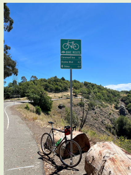
Grizzly Peak Blvd 上的新標誌可幫助騎自行車的人找到他們的目的地。