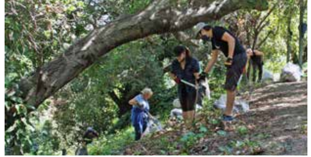
Voluntarios limpian Courtland Creek Park, junio de 2021