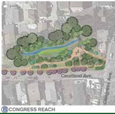
B CONGRESS REACH