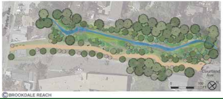
C BROOKDALE REACH