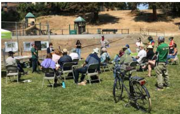
Reunión comunitaria sobre el proyecto de restauración de Courtland Creek, julio de 2021