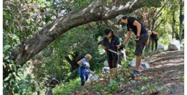
Voluntarios limpian Courtland Creek Park, junio de 2021