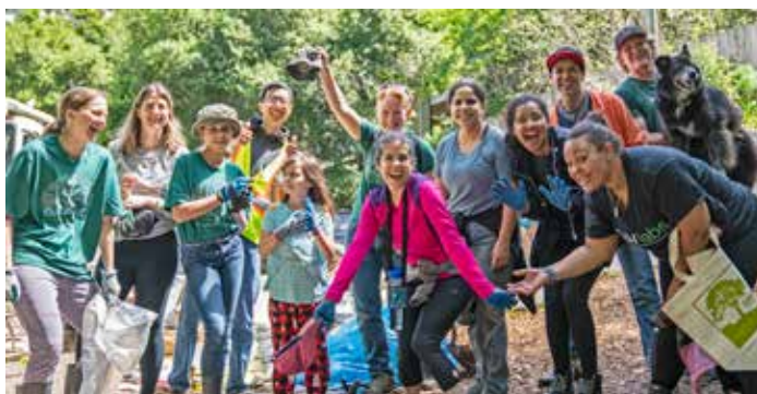
Los voluntarios ayudan en el Día de la tierra, 2019