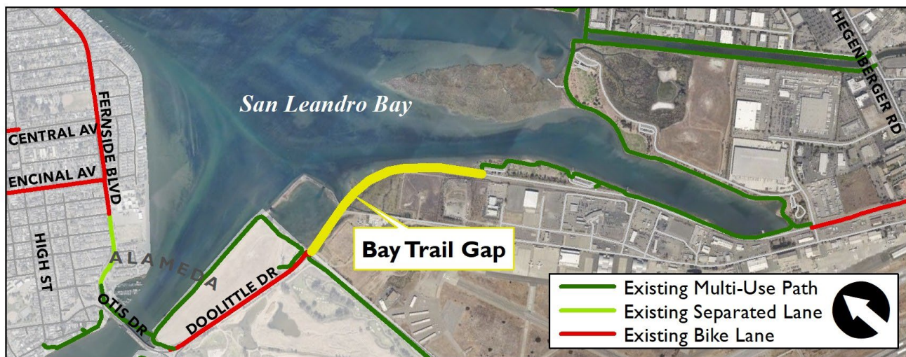
圖片：Doolittle Drive 沿線剩餘的海灣步道間隙地圖 (黃色)

Doolittle Drive (61 號州際公路) 毗鄰 EBRPD 海岸線公園，路權寬度有限，海拔較低，易受海平面上升的影響。由於建造自行車和行人通道的複雜因素，OakDOT 工作人員對 MTC 主動交通技術援助項目 (Active Transportation Technical Assistance Program) 表現出的興趣作出回應，MTC 建議提供 40,000 美元的設計援助資金。技術援助項目的主要目標是協調各利益相關方，為騎自行車的人和行人制定短期改進方案。