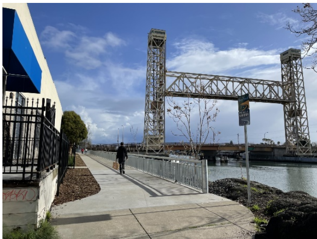
Hình ảnh: Đoạn đường Bay Trail mới giữa Cầu Park Street và Fruitvale Ave

Người đi xe đạp và người đi bộ sẽ còn dễ tiếp cận hơn nữa khi dự án Fruitvale Alive! hoàn thành các giao lộ và lối qua đường. Hướng về phía đông nam, người đi xe đạp và người đi bộ sẽ có lối qua đường Fruitvale Ave được cải tiến, kết nối với con đường đa năng hiện có đến High St.