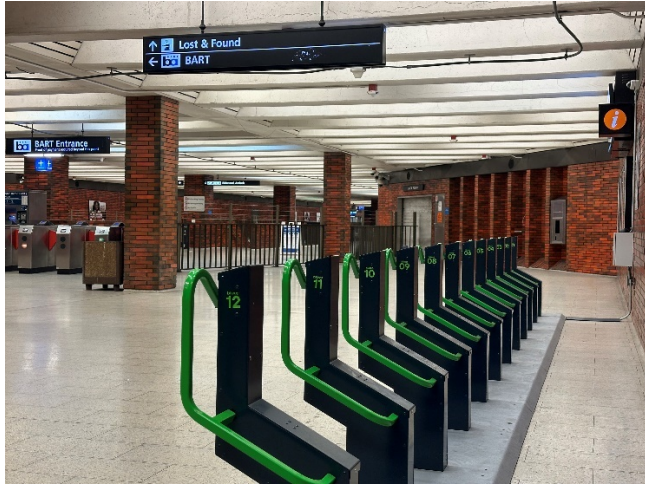
Hình ảnh: Giá xe đạp an toàn Bikeep tại trạm BART 12 th Street

Vẫn cần nhiều công sức để mang theo xe đạp lên thang cuốn; một lựa chọn khác là sử dụng thang máy. Vì xe đạp ngày càng lớn hơn và có thể không vừa với mọi nơi nên BART đã xuất bản hướng dẫn về kích thước thang máy .