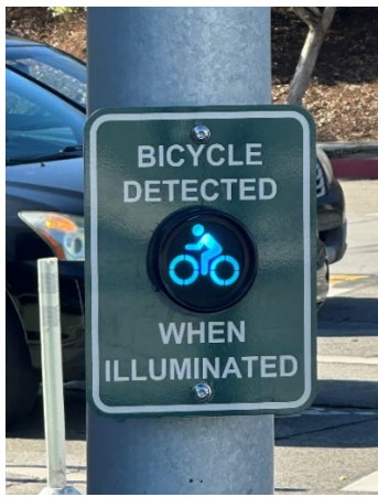
2. Đèn phát hiện sẽ sáng lên khi người đi xe đạp chờ ở giao lộ.