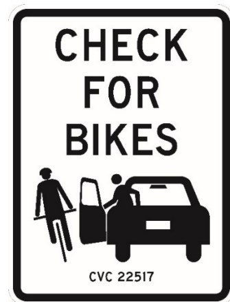
Hình ảnh: Biển báo Chú Ý Xe Đạp