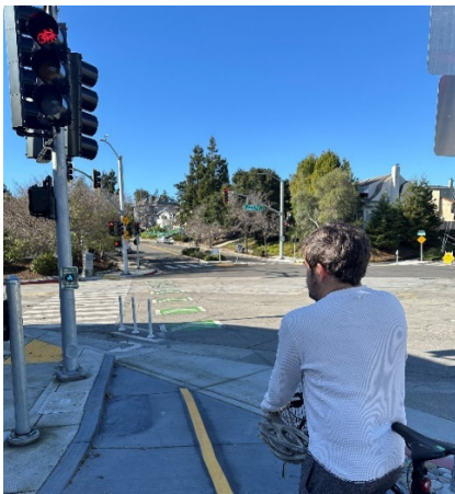
1. Một người đi xe đạp đang chờ để đi qua giao lộ Park Blvd/Excelsior Ave theo hướng bắc/tây. Đèn báo xe đạp mới báo cho người đi xe đạp biết thời điểm để đi qua.

Dự án này cải thiện khả năng tiếp cận cho người đi xe đạp đi về phía tây trên Excelsior Ave và kết nối với Park Blvd hoặc Grosvenor Pl. Giao lộ này là một phần của Đường Xe Đạp MacArthur Blvd. Đây là đường xe đạp liên tục từ Hồ Merritt đến Cao Đẳng Mills. Dự án Sang Đường An Toàn được phát triển để cải thiện sự an toàn cho học sinh đi bộ và đi xe đạp đến Trường Trung Học Cơ Sở Edna Brewer. Ngoài những cải thiện được thảo luận trên đây, dự án đã giúp các giao lộ của Park Blvd trở nên đơn giản hơn tại 13 th Ave, E 38 th St, Park Blvd Wy và Greenwood Ave với vỉa hè được mở rộng và đèn giao thông mới tại 13 th Ave. Để biết thêm thông tin chi tiết, hãy truy cập trang web của dự án tại oaklandca.gov/projects/crossing-to-safety-project .