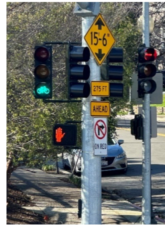
3. Đèn báo xe đạp chuyển sang màu xanh lục khi đến lượt người đi xe đạp qua đường.