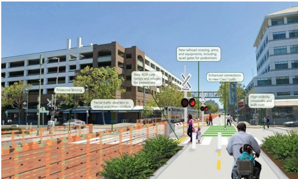
Hình ảnh: Nghệ sĩ đưa ra các cải tiến cho Embarcadero West

OakDOT đã nhận được 30,2 triệu USD tài trợ, bao gồm cải thiện an toàn cho người đi xe đạp và người đi bộ, thông qua Chương Trình Tăng Cường Hành Lang Thương Mại (TCEP). Ngoài các quỹ khác của tiểu bang, khoản tài trợ TCEP này sẽ góp phần đem lại Các Cải Tiến về An Toàn và Quyền Tiếp Cận Đường Sắt Tây Embarcadero , kéo dài từ Market Street đến Oak Street. Dự án này sẽ xây dựng một tuyến đường đa năng, xây dựng lại tám điểm giao cắt có cùng độ cao, lắp đặt hàng rào và cải thiện bảy đoạn đường giữa Embarcadero West và 2nd Street và một đoạn giữa Embarcadero West và 3rd Street. Những cải tiến ở cùng độ cao bao gồm đường ray, thanh chắn tàu và thiết bị cho người đi bộ, biển báo, phân định vỉa hè và hệ thống chiếu sáng giao lộ mới. Dự án cũng sẽ bao gồm việc lắp đặt các đèn giao thông mới, cải thiện mức độ an toàn và khả năng tiếp cận đa phương thức, đồng thời bao gồm các cây xanh và cảnh quan. Những cải tiến này sẽ tạo ra kết nối an toàn hơn cho người đi bộ và người đi xe đạp dọc theo Embarcadero West và với mạng lưới đa phương thức lớn hơn.