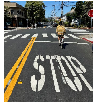
(上圖) 從西 MacArthur 大道到第 40 街隻雞的 Webster 街進行升級