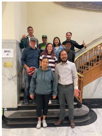
(上圖) BPAC 委員在 2024 年 6 月會議上