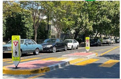
(上圖) 第 8 街的行人安全島

西屋崙第 8 街交通穩靜工程於 2024 年 6 月竣工，透過一系列全面的改進，對 Prescott 和 Acorn 社區第 8 街的 1.2 英里處進行全面改造。這項工程實施圓環交通號誌、減速帶和實體化中央分隔線，以及新人行道、升級路緣坡道、高能見度的行人穿越道，以及在兒童保育中心設立行人安全島的新中間街區行人穿越道。超速車輛和魯莽駕駛，包含車輛偏離道路等情形，促使居民組成「安全的第 8 街」社區團體。為了引起民眾注意這些挑戰，該團體收集超速資料並發佈社區汽車撞上柵欄和房屋的故事。他們的發現和社區組織從本市 2021-2023 財年資本改善計畫中獲得 50 萬美元的專案資金。