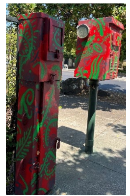
下列藝術家創作的特色變電箱壁畫 (由左至右) : Refa One (1, 2) 、Nyia Luna (3, 4) 、灣區壁畫計畫 (5)