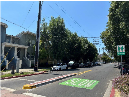
第 8 街和 Mandela 公園大道的慢行街道設施包含實體化中央分隔線、慢」行人標記和「慢街」標誌

在西屋崙第 8 街交通穩靜計畫回應居民組織和社區需求的同時，它也是減速慢行街道專案的範例 – 一條對居民來說穩靜的街道，為屋崙居民步行、騎自行車、慢跑和旅行提供良好的路線。如要瞭解有關 OakDOT 在整個屋崙實施慢街理念的更多資訊，請瀏覽 www.oaklandca.gov/projects/oakland-slow-streets 。