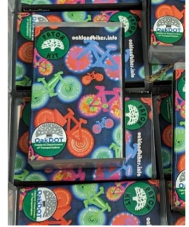
(ảnh trên) Thiết kế Bộ Miếng Vá Lốp Xe Đạp của Thực Tập Sinh OakDOT, Angie Chen

Ngày Đạp Xe Đến Bất Cứ Đâu (trước đây gọi là Ngày Đạp Xe Đi Làm) diễn ra vào ngày 16 tháng 5 năm 2024.