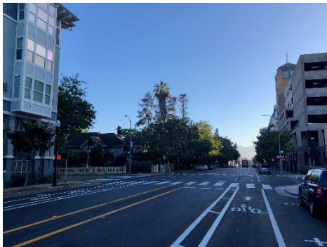
(ảnh trên) Các làn đường dành cho xe đạp có giảm xóc ở trung tâm thành phố MLK Jr Wy

Vào tháng 5 và tháng 6, hai tuyến đường dành cho xe đạp lâu đời trong khu phố – Đường Webster từ W MacArthur Blvd đến Đường Số 40 và Đường Cavour từ Claremont Ave đến Shafter Ave – đã được trải nhựa lại và nâng cấp. Mặc dù mỗi đường phố được trải nhựa theo một cơ chế khác nhau (Webster thông qua việc phục hồi sau một dự án tiện ích ngầm, Cavour thông qua hợp đồng làm lại mặt đường nhiều tuyến phố), chúng là những ví dụ về nỗ lực hiện có trên toàn thành phố nhằm cải tiến cơ bản để giảm tốc độ giao thông theo đề xuất trong Hướng Dẫn Triển Khai Tuyến Đường Dành Cho Xe Đạp Trong Khu Phố của Thành Phố (chẳng hạn như gờ giảm tốc, kiểm soát dừng trên các đường phố giao nhau và vòng xuyên) thông qua các dự án trải nhựa thông thường. Hơn một nửa số tuyến đường dành cho xe đạp trong khu phố do Thành Phố đề xuất đều nằm trong Kế Hoạch Trải Nhựa 5 Năm . Đây có thể là những thành tựu nhỏ, nhưng là những ví dụ ban đầu cho nỗ lực điều phối hoạt động trải nhựa đường liên tục được cải thiện theo thời gian và hứa hẹn sẽ mang lại những cải thiện về chất lượng cuộc sống trên nhiều tuyến phố ở Oakland.