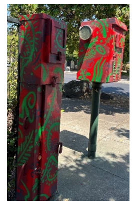
Những bức tranh tường trên hộp tiện ích nổi bật của các nghệ sĩ sau (từ trái sang phải): Refa One (1, 2), Nyia Luna (3, 4), Chương Trình Tranh Tường Vùng Vịnh (5)