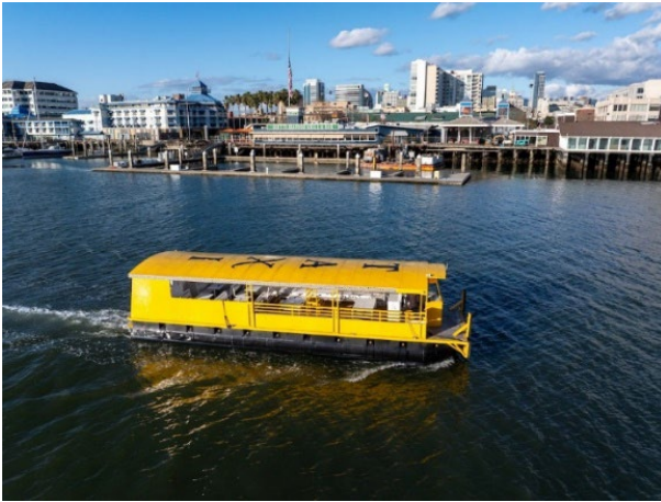
Ảnh chụp Woodstock, Chiếc Taxi Nước ở Cửa Sông

Kết quả khảo sát cho thấy Woodstock sẽ được ưa chuộng và 68% số người được hỏi cho biết họ muốn mang theo xe đạp lên tàu. Dịch vụ bắt đầu vào ngày 17 tháng 7 và người đi phà có thể xem lịch trình, tìm hiểu thêm và đăng ký nhận thông tin cập nhật qua email tại trang web đưa đón bằng đường thủy .