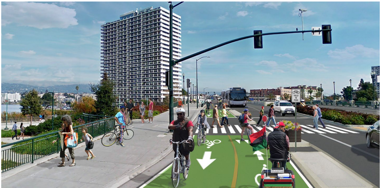
Bản vẽ phối cảnh làn đường hai chiều dành cho xe đạp được bảo vệ ở Lake Merritt Blvd

Các dự án được mô tả trong tài liệu này được tài trợ một phần hoặc toàn bộ bằng phần thuế doanh thu vận tải trên toàn quận đã được cử tri phê duyệt của Oakland. 8% quỹ theo Dự Luật BB được dành riêng cho các dự án và chương trình dành cho xe đạp/người đi bộ trên toàn quận. Để biết thêm thông tin, hãy truy cập oaklandca.gov/topics/measure-b-bb-and-vehicle-registration-funds .