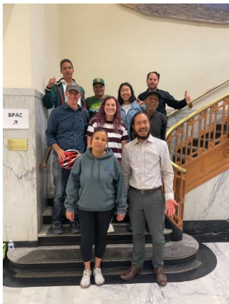
(ảnh trên) Ủy Viên BPAC tại Cuộc Họp tháng 6 năm 2024