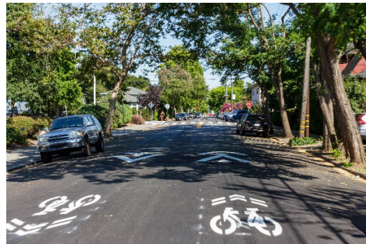
(ảnh trên) Đường Cavour được nâng cấp từ Đường Claremont đến Đường Shafter