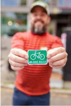
(ảnh trên) Kỷ niệm Ngày Đạp Xe Đến Bất Cứ Đâu bằng miếng vá lốp xe mới