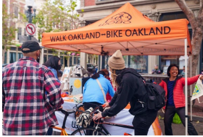
(ảnh trên) Những người tham dự Ngày Đạp Xe Đến Bất Cứ Đâu ghé thăm gian hàng tại Trạm Energizer.