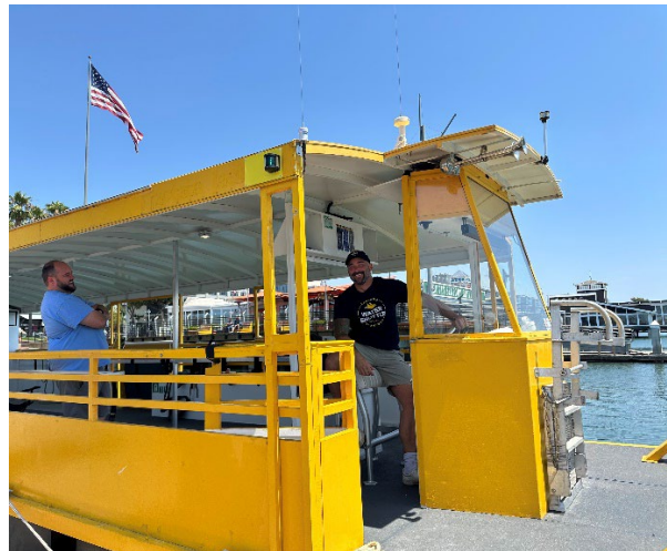
Ảnh chụp Woodstock, Chiếc Taxi Nước neo đậu tại Quảng Trường Jack London