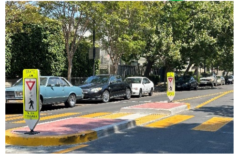
(ảnh trên) Đào dành cho người đi bộ trên Đường Số 8

Hoàn thành vào tháng 6 năm 2024, Dự Án Giảm Tốc Độ Giao Thông trên Đường Số 8 của West Oakland đã cải tạo 1,2 dặm Đường Số 8 ở các khu phố Prescott và Acorn bằng một loạt cải tiến toàn diện. Dự án đã triển khai các vòng xuyên, gờ giảm tốc và vạch kẻ đường cứng, cũng như vỉa hè mới, nâng cấp đường dốc lên xuống, lối đi dành cho người đi bộ để quan sát và lối đi dành cho người đi bộ giữa dãy nhà mới có đảo an toàn cho người đi bộ tại một trung tâm chăm sóc trẻ em. Những phương tiện chạy quá tốc độ và hành vi lái xe liều lĩnh, bao gồm cả xe đi chệch khỏi đường, đã thúc đẩy người dân thành lập nhóm khu phố “Đường Số 8 An Toàn”. Để thu hút sự chú ý đến những thách thức này, nhóm đã thu thập dữ liệu về tốc độ và công bố những câu chuyện của hàng xóm về những chiếc xe đâm vào hàng rào và nhà cửa. Những phát hiện và hoạt động tổ chức cộng đồng của họ đã thu hút khoản tài trợ dự án trị giá $500,000 từ Chương Trình Cải Thiện Cơ Sở Hạ Tầng Năm Tài Chính 2021-2023 của Thành Phố.