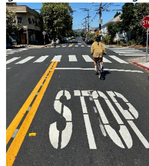
(ảnh trên) Đường Webster được nâng cấp từ W MacArthur Blvd đến Đường Số 40