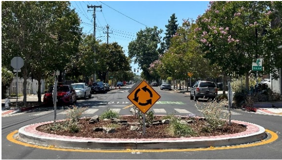
(ảnh trên) Vòng xuyên trên Đường Số 8