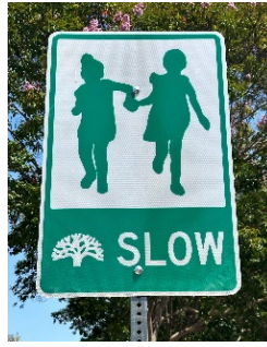
(ảnh trên) Biển báo “Đi Chậm” trên Đường Số 8