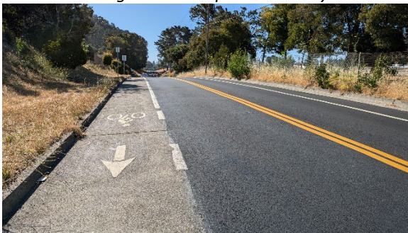
(ảnh trên) Mountain Blvd từ Calavera Ave đến Kuhnle Ave với làn đường dành cho xe đạp mới