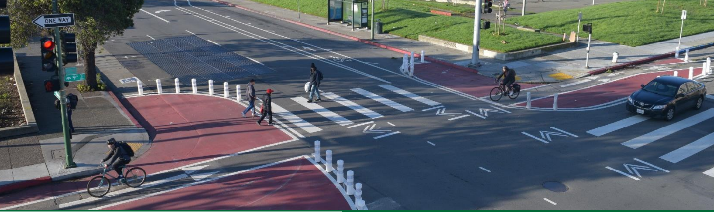
Hình ảnh của 8 th Street tại Madison Street